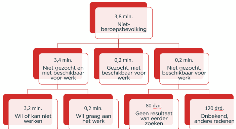
Figuur 2 Samenstelling niet-beroepsbevolking